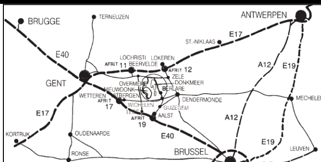
Figuur 2: Schets wegbeschrijving

Dan over de brug van schoonaarde Berlare binnen rijden. Tot op het dorp. Daar meedraaien met de kerk (naar links) en dan direct na de kerk naar rechts. Dan ongeveer 3 km doorrijden en de parking festivalhal bevindt zich aan de linkerkant.